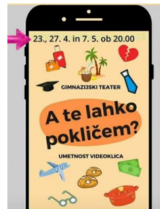
Slika 4: Predstava A te lahko pokličem?

21. 12. – proslava v obliki filma ob Dnevu samostojnosti in enotnosti – dijaki so si ga ogledali na razrednih urah. Zamisel in izvedba: Marija Palovšnik.