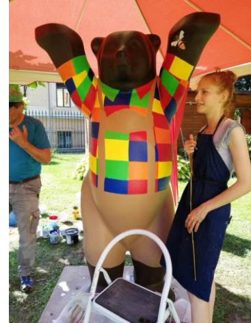
Slika 6: Barvanje medvedka pred nemško ambasado v Ljubljani