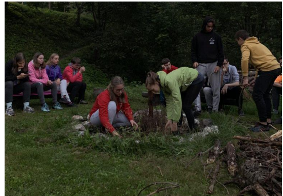
Slika 2: Šola v naravi v Peci