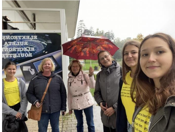
Slika 3: Govori z menoj

pet. 2. 10.: Akcija »Pogovori se z menoj« v kateri so sodelovali dijaki Gimnazije Jesenice, Srednje šole Jesenice ter študentje Višje strokovne šole za turizem in gostinstvo Bled