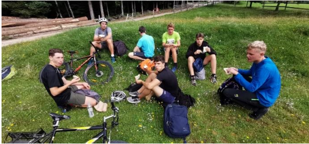
Slika 1: Utrinki iz tabora Gorenje na Pohorju